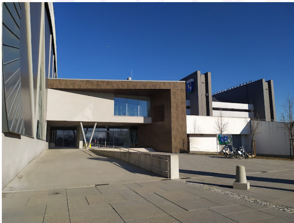
Pohled na hlavní vchod