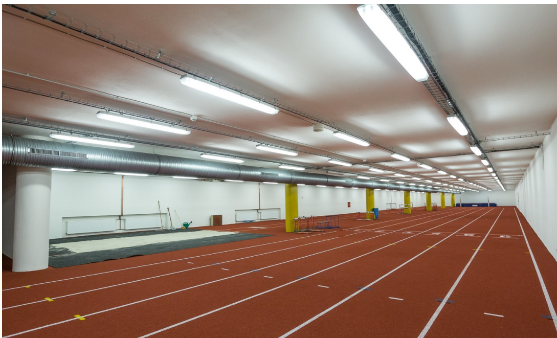
Prostor pro šatny „tunel“