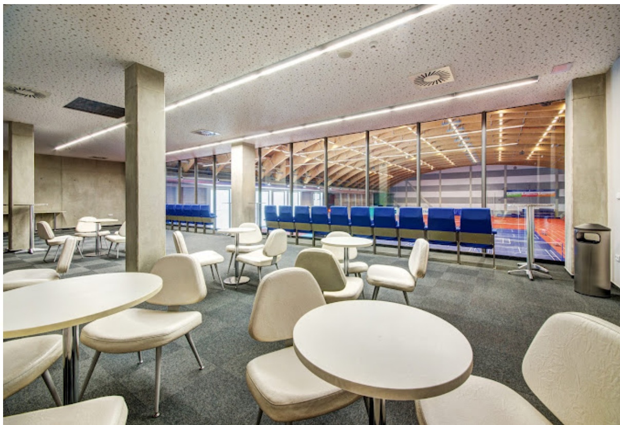
Prostor pro VIP - I. patro

Rodiče, kteří chtějí pomoci s česáním, líčením a oblékáním soutěžících a mají náramek (vstupenku) mohou tak učinit v přístupových cestách haly, na tribuně pro mažoretky anebo přímo ve společné šatně. Nezapírejte místo na tribuně pro diváky, sektory A, B a C, prostor ve vestibulu a vchod na tribuny.