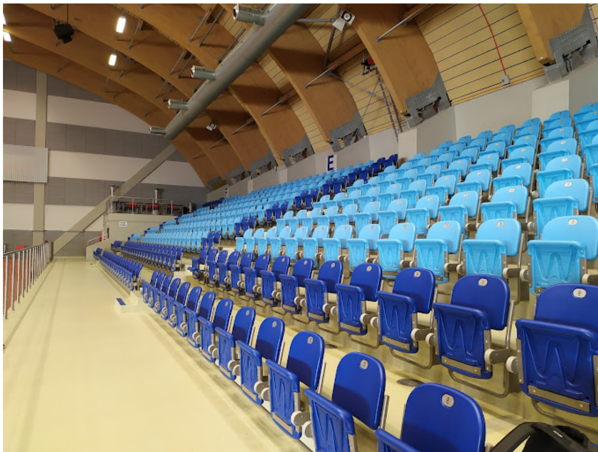
Tribuna D, E a F pro závodnice, tribuna A, B a C pro diváky