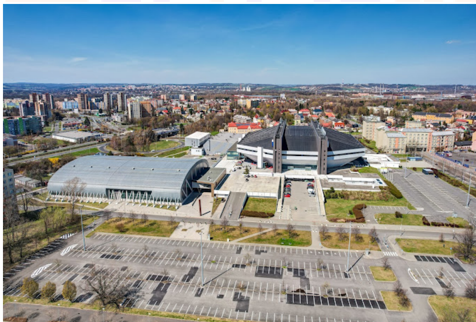
Celkový pohled na areál i na parkoviště