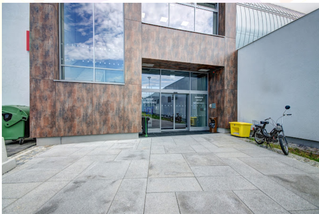
Pohled na zadní vchod